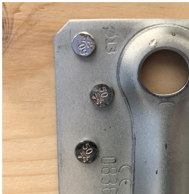
Le marquage sur le connecteur, en plus du marquage sur les têtes de pointes, permet une vérification facile après la pose.