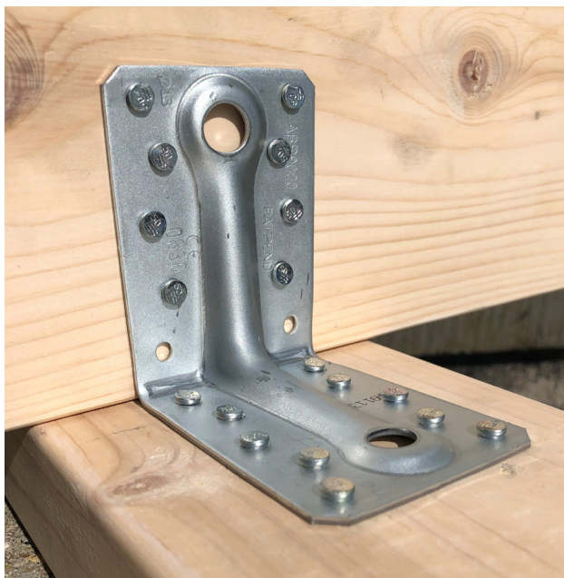
Équerre renforcée ABR9020 installée avec des pointes connecteurs CNA4.0X50.

Les pointes CNA, qui disposent de cette nouvelle empreinte de tête, se déclinent sous différentes longueurs et dimensions. Voir la page suivante pour plus d'informations.